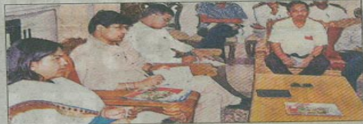
पलामू दौरे के बाद गुरुवार को जिला प्रशासन के अधिकारियों के साथ बैठक करते राष्ट्रीय बाल अधिकार संरक्षण आयोग के सदस्य।