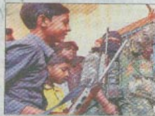
स्कूल का ताला तोड़ते नक्सली