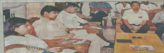
पलामू दौरे के बाद गुरुवार को जिला प्रशासन के अधिकारियों के साथ बैठक करते राष्ट्रीय बाल अधिकार संरक्षण आयोग के सदस्य।