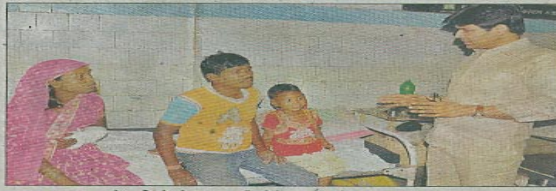
सर अस्पताल में मरीजों से जानकारी लेते आयोग के सदस्य।